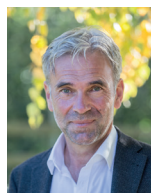
Landesrat Arnold Schuler

Auch wenn durch höhere Gewalt ein herausforderndes Jahr auf die Holzbranche zukommt, so bin ich trotzdem überzeugt, dass der Forst- und Holzwirtschaft eine gute Zukunft bevorsteht.